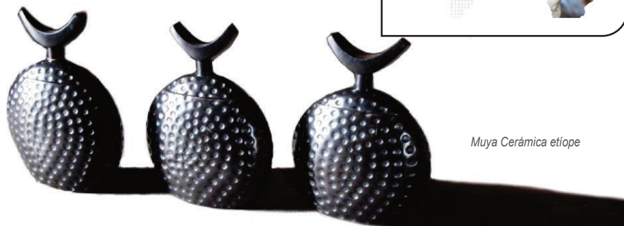
Muya Cerámica etíope

Nuestros servicios en línea son utilizados por: