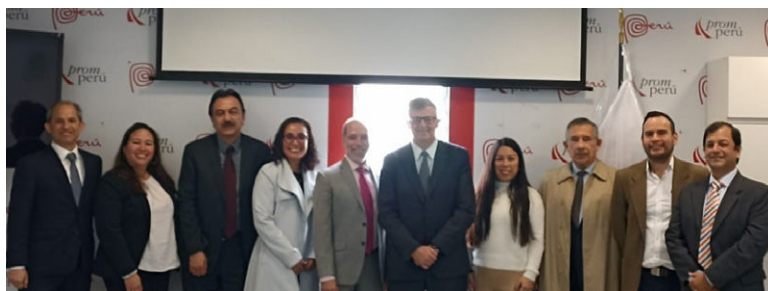
Mission de détermination de la portée de TFO Canada au Pérou avec PROMPERU

14 DOCUMENTS JURIDIQUES ONT ÉTÉ AMÉLIORÉS