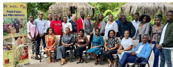
Formation à l'exportation en Haïti pour les PME du secteur du commerce électronique numérique et de l'aromathérapie

913 dans des domaines clés tels que la préparation à l'exportation, le changement climatique et la responsabilité sociale des entreprises (RSE), le commerce électronique et le marketing numérique,