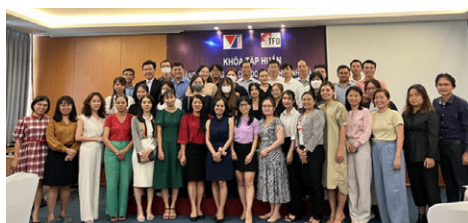
Formation sur l'état de préparation à l'exportation des PME au Vietnam