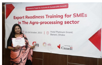
Formation sur la préparation à l'exportation pour les PME dans le secteur agro-industriel au Bangladesh