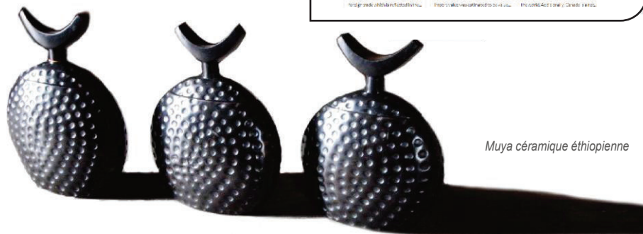
Muya céramique éthiopienne